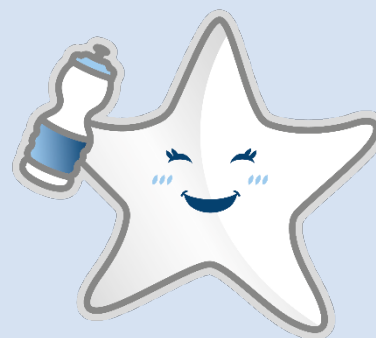
Miss Star Bene